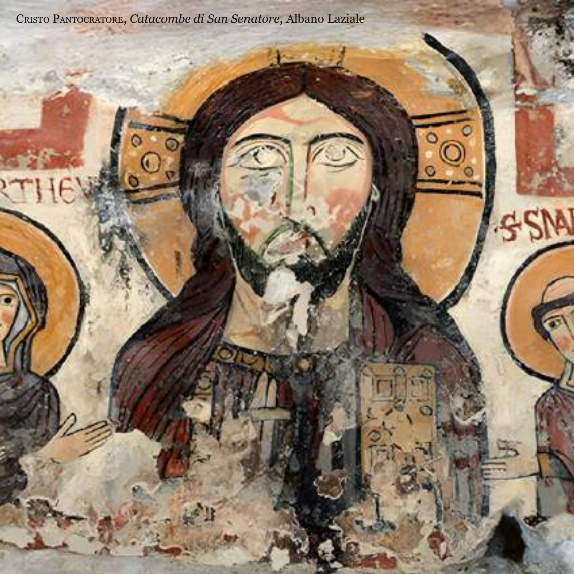
CRISTO PANTOCRATORE, Catacombe di San Senatore, Albano Laziale